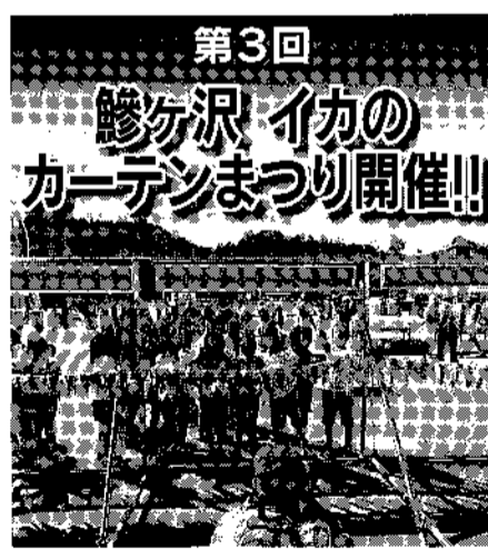
第3回 鯉ヶ沢イカのカーテンまつり開催

私も女性部長に就任し二年目の新年を迎えることができました。部長として力不足・勉強不足にもかかわらず部員の温かい協力のおかげで、どうにか二年目を迎えられることに感謝しております。 毎年の行事である「花いっぱい運動」も二十六年目を迎えました。ピンクのジャンパーの女性部員が、にぎやかに楽しく駅前には花を植える行事も部員・関係者の協力で無事に終えることができました。 先輩部員の残してくれた、すばらしい事業を引き継ぎ、続けていくことは部員の使命でもあります。又、こうして協力しあいながら楽しく行うことで強い絆が生まれる事を実感します。その絆が九月に行われた「イカのカーテンまつり」でも発揮されました。三回目でもある「イカのカーテンまつり」は天候にも恵まれ部員の協力により大成功に終わりました。反省する事もありますが、その反省点を踏まえて楽しく、元気に挑戦していきたいと思つております。 今年、つがる市・深浦町・鯉ヶ沢町の西つがる女性部によって「秘境散策コース」のパンフレットも完成の予定です。 消費税八パーセントや米の価格の暴落により、お客様の購買意欲も低迷しているのが現状です。今年「羊年」です。羊は穏やかで優しく正義感が強い真面目な性格だそうです。 私たちが、この一年、足元を見つめ羊のように過ごしていきたいと思ひます。少しでも地域の振興発展に寄与できるように努めたいと思つておりますので皆様のご協力よろしくお願ひいたします。 新しい年が良き年になりますよう心からお祈りして新年の挨拶とさせていただきます。